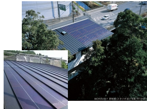
フレキシブルアモルファスシリコン太陽電池