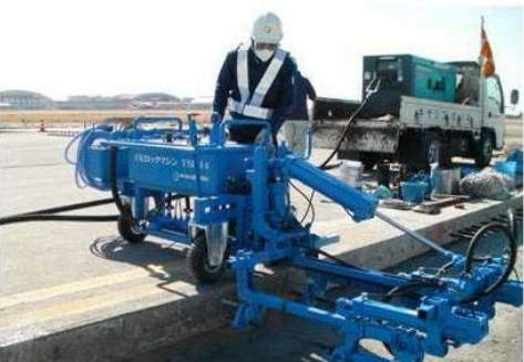
新型削孔機による削孔作業