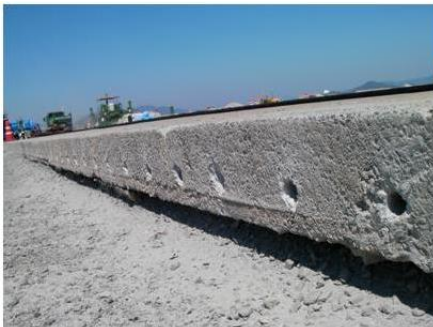
既設版削孔作業後の状況