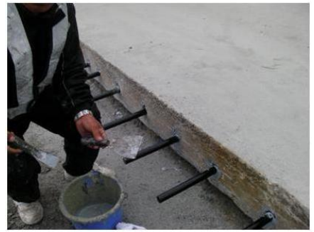
専用剤による棒鋼固定作業