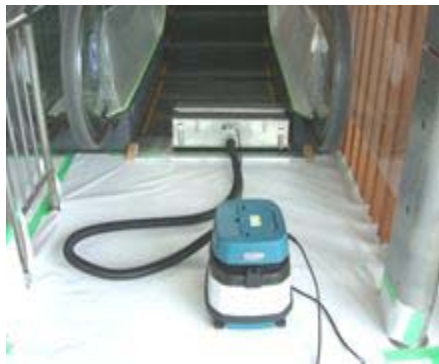
踏板ブラシとバキュームクリーナー