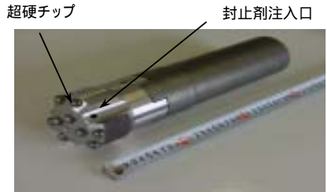
超硬ビットの外観