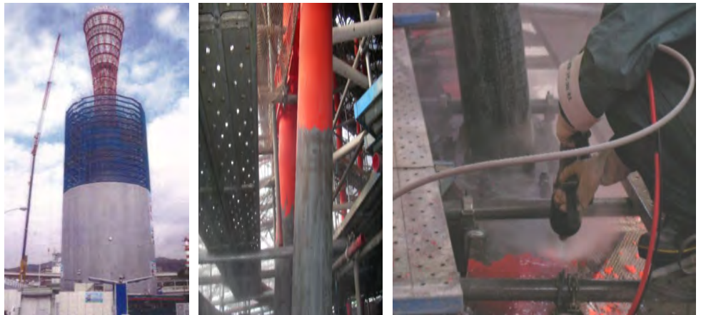
神戸ポートタワーでの試験施工例