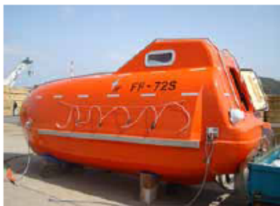
自由降下式救命艇 全長7.2m 全幅2.74m 定員30名