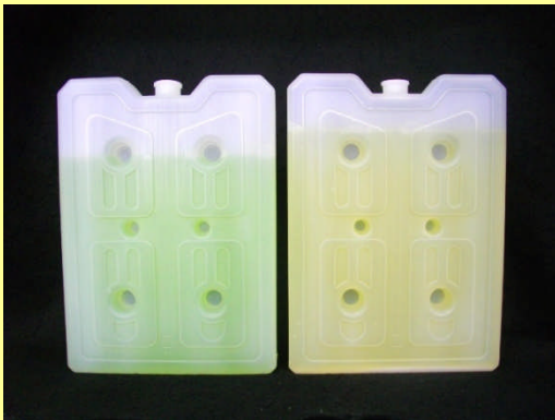
所定低温度での保冷時間を飛躍的に向上させた保冷剤