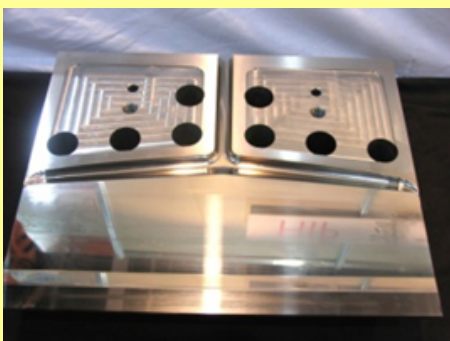
特殊HIP素材への超精密研削加工によるTダイ金型 及び ダイリップ