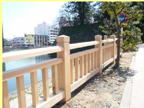
福井城址のお堀にかかる橋の欄干