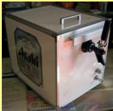
従来型ビールサーバー