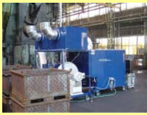
装置概観(吐き出し口側)