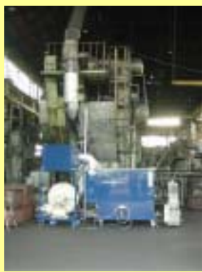
鍛造機に装着された装置