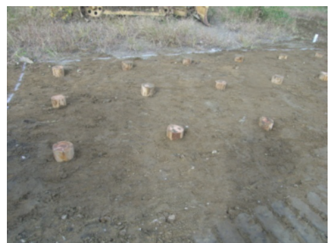
完了後の地盤表面