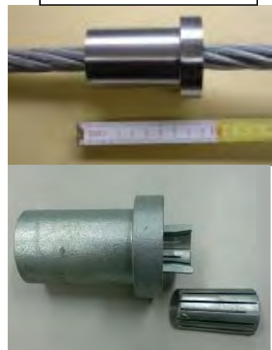
緩衝金具(特許出願中)