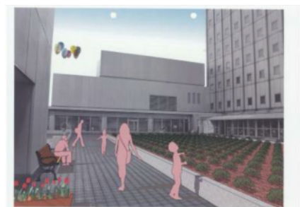
屋上農園ビルの様子