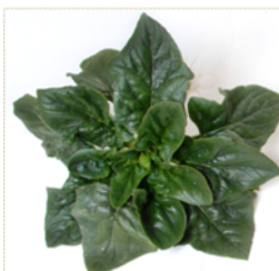
連作障害を回避した ハウレンソウ (10年以上連作)