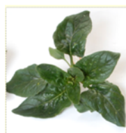
連作障害により生育 不良なハウレンソウ