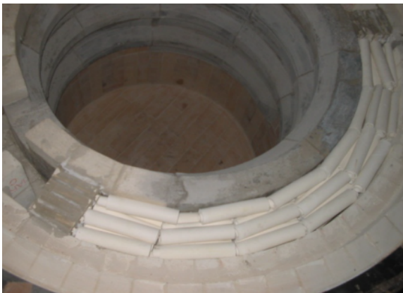
パイプ状の蓄熱体