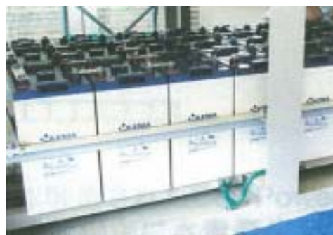
非常用電源設置例

1 制御弁式据置鉛蓄電池: 電池内で発生したガスを内部吸収し、電解液が減らないよう密閉化した据置蓄電池。メンテナンスに手がかからず、安全性が高いという特長があり、現在据置型蓄電池で主流となっている形式。