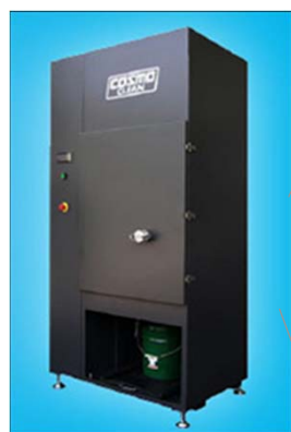
衝撃振動式集塵機