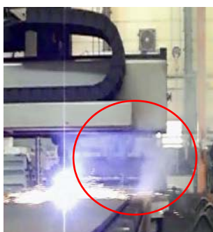
レーザ加工時等に出るヒューム(金属蒸気等)