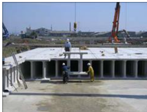
雨水地下貯留槽施工例