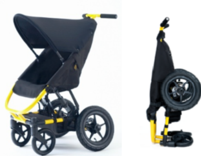
組み合わせデザイン例