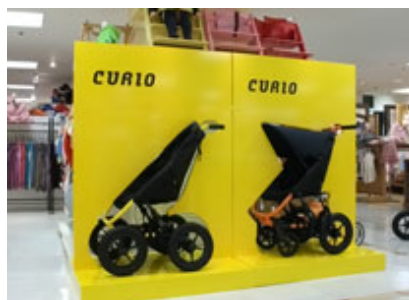
百貨店販売シーン