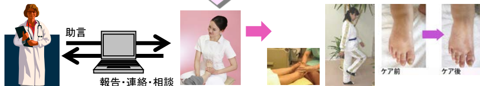
医師とケアセラピストマスターとの連携システム