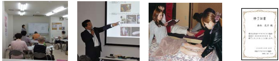
ケアセラピストマスターの養成