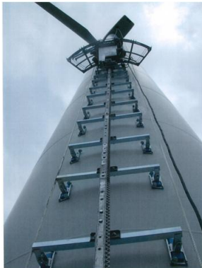
風力発電タワーのメンテナンス