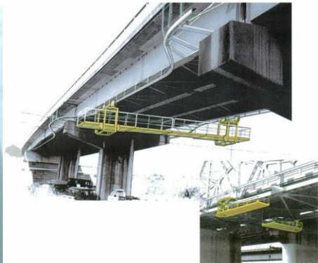
橋脚メンテナンスのイメージ図