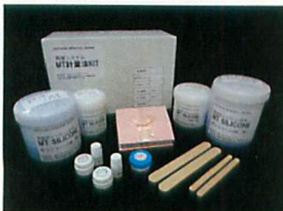
再建システムキット