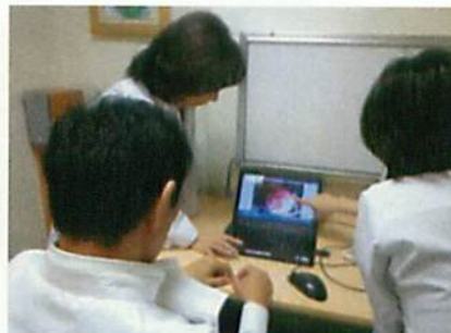
指導マニュアルビデオの視聴風景