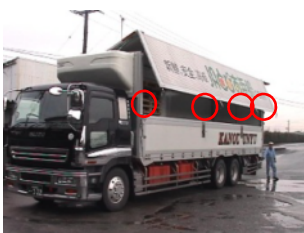
大型トラック設置例