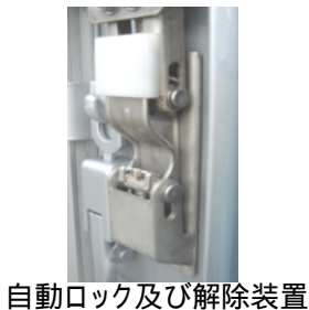
自動ロック及び解除装置