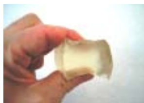
エアフリーゲル(常温)