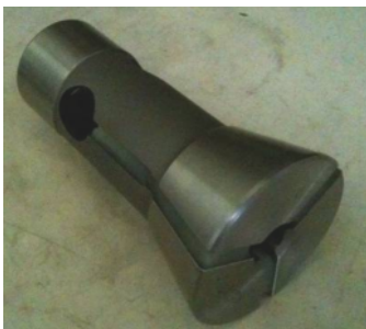
コレットチャック