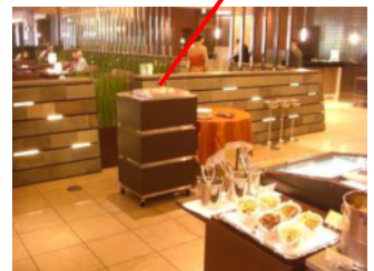
ホテルbuffet利用シーン