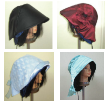
外部カバーのデザイン例