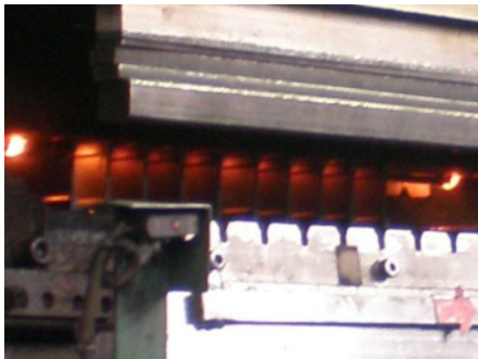
高張力鋼の特性を利用して溶着コストを低減