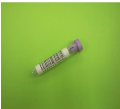
バーコード付き血液採集容器