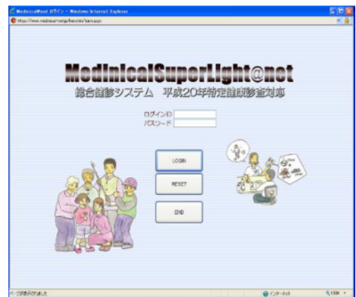
システムメニュー画面