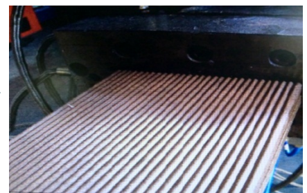
押し出し成形後のPPC