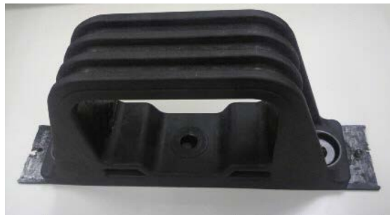
自動車エンジンマウントの 開発技術による試作例