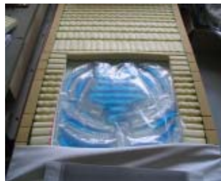
ウォーターマット搭載マットレス