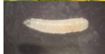
上: 糖尿病性壊疽患者の治療前と治療後の足の写真 右上: ヒロズキンバエ(成虫) 右下: 医療用無菌ウジ