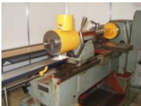
インターナルブローチにおける製品例