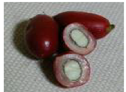
ミラクルフルーツ果実