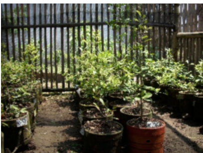
ミラクルフルーツの苗木