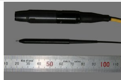
プロトタイプ(左)と連携開発対象(右)のモックアップ