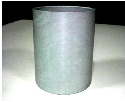
低発塵紙管(開発品)