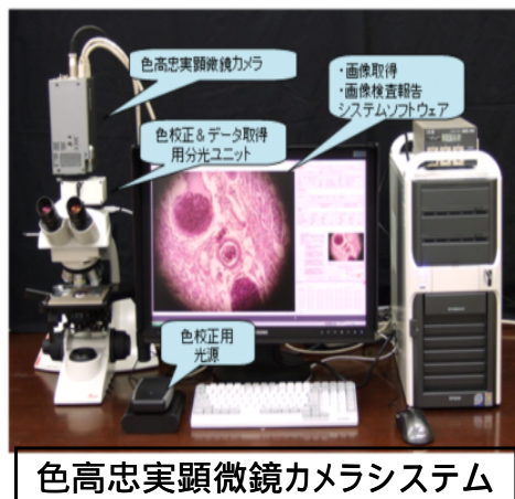
色高忠実顕微鏡カメラシステム