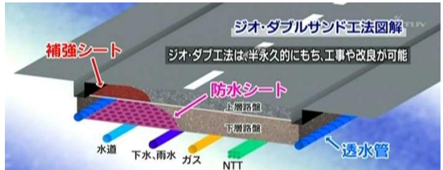
ジオダブルサンド工法の概要図