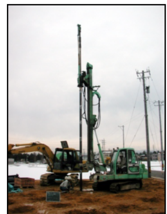
地中採熱杭ジオコレクター施工状況