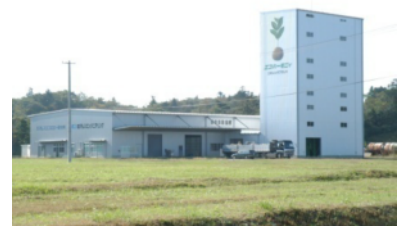
修復剤・浄化材製造工場