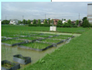
東京農工大学フィールドセンター