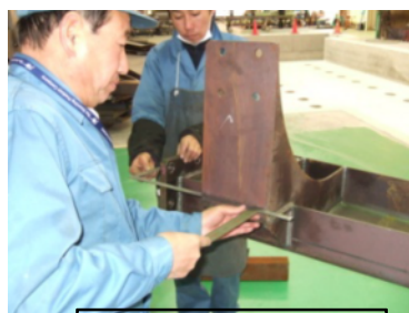
現場での測定(複数の作業者が必要)