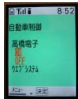
エンジン制御画面