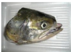
サケ頭部未利用部位