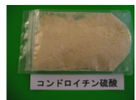
コンドロイチン硫酸