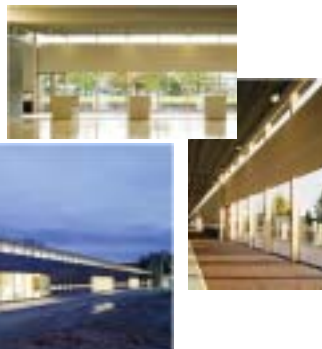
陸別町診療所・保健センター