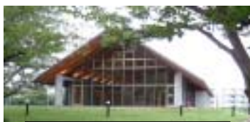
北海道大学遺友学会