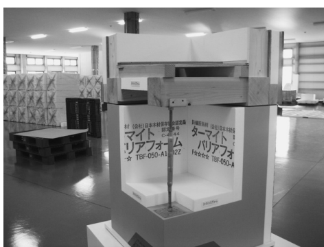
防蟻断熱ボード (ターマイトバリアフォーム)

同社は、前述の「がんばる中小企業・小規模企業300社」表彰式に展示ブースを設置、ブースを訪れた中小機構の職員から支援事業の紹介を受けた。中小機構の専門家のアドバイスも受けながら事業計画を策定し、平成27年2月に地域資源活用事業計画の認定を受けた。