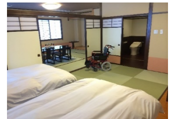
【バリアフリー特別室】

地域産業資源「小野川温泉」の価値を高めるため成分分析の結果を積極的に開示する。山形県、米沢市及び米沢商工会議所に支援を仰ぐ。加えて、“小野川温泉観光知実行委員会”や“温泉米沢八湯会”と連携しながら地域を挙げて更なる小野川温泉のブランド化に向けて取り組んでいく。