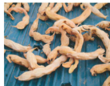
乾燥状態の漆野いんげん豆