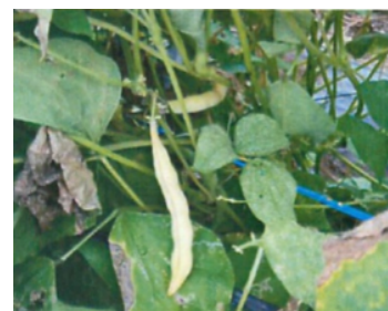
収穫直前の漆野いんげん豆