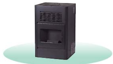
【木質ペレットストーブ(家庭用)】