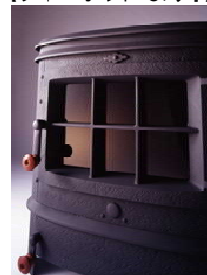
【ペレットストーブ「ベチカ禅」】