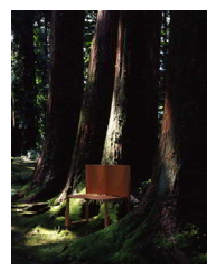
【折畳み椅子2人かけ】